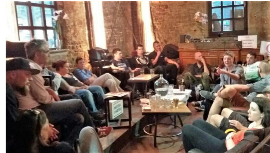
Konferenz der Kleinen Parteien 2018