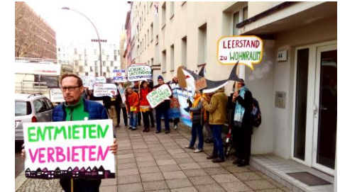
Mieterinnenkampf der Initiative IGHab und Neuen Heimat Mitte in der Habersaathstraße in Berlin,