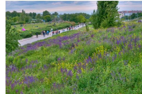
Mauerpark in Pankow im Sommer

Quelle 1: Curitiba, ist eine Stadt in Brasilien, die für ein effizientes öffentliches Transportsystem und eine nachhaltige Stadtentwicklung seit den 1970er-Jahren international bekannt. https://www.aufuhr-magazin.de/klimaschutz/curitiba-der-stern-brasiliens/ , https://de.wikipedia.org/wiki/Metr%C3%B4_de_Curitiba