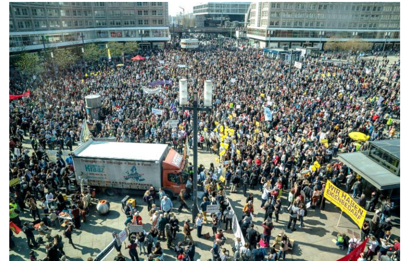
Mietenwahnsinndemo 2019 mit ca. 40.000 Menschen