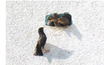
Stare nach Einschuss der Einfluglöcher mit Bauschaum gerettet ( https://youtu.be/Y6DU1kJmHzo )